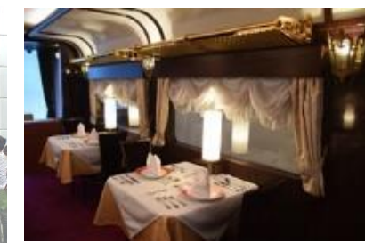
再現車両公開イベント