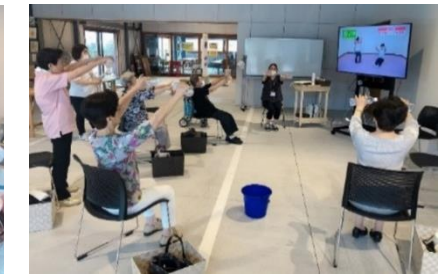
まちなか健康運動教室