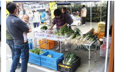
地元野菜の販売会（西海地区）