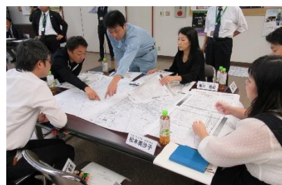
駅北復興まちづくり市民会議