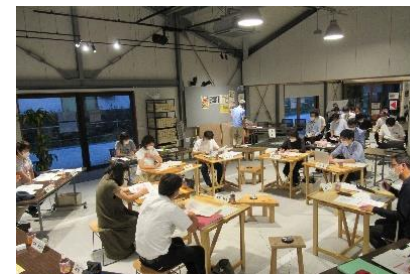
駅北まちづくり市民会議（実践会議）