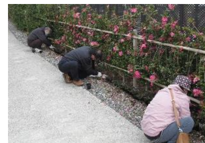
令和2年度：緑町区の皆さん