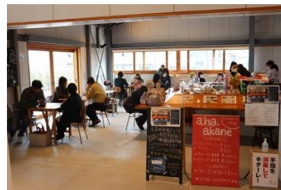
シェアキッチンでの営業