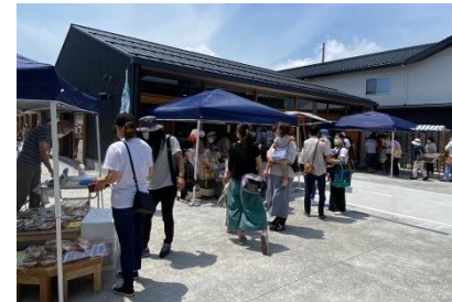
キターレマーケット

夕方には、勉強する学生の姿もあり、これまでに見られなかった世代の人たちが見られるようになったとの声もいただいている。また併設するシェアキッチンは、昨年度延べ47件の利用があり、これまでに2名が自身の店を開業しています。