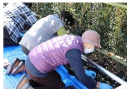
平成31年度：大町区の皆さん