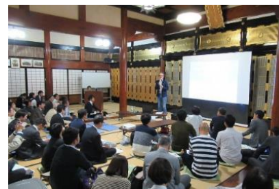
まちづくりシンポジウム