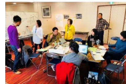
リノベーションスクール