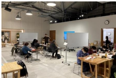
放課後に勉強する高校生