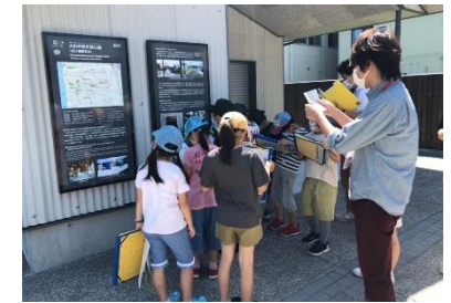
児童防災学習（まち歩き）